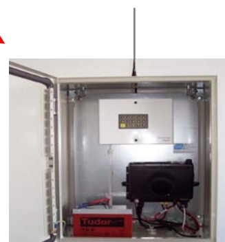
DATI-FIXE DIMENSIONS : 400X300X200