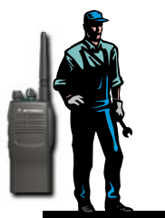
PORTATIFS EQUIPES D'UN MODULE PTI